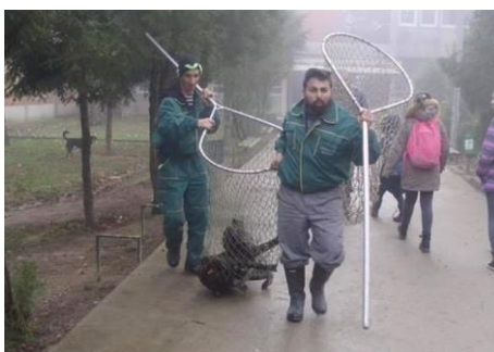
Der Staat tut schon etwas ...