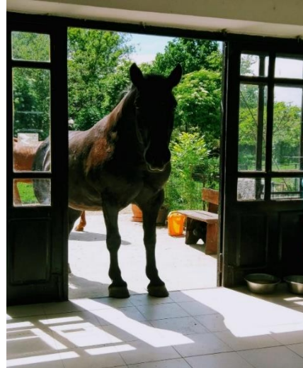
Die freche Mira wäre am liebsten überall dabei