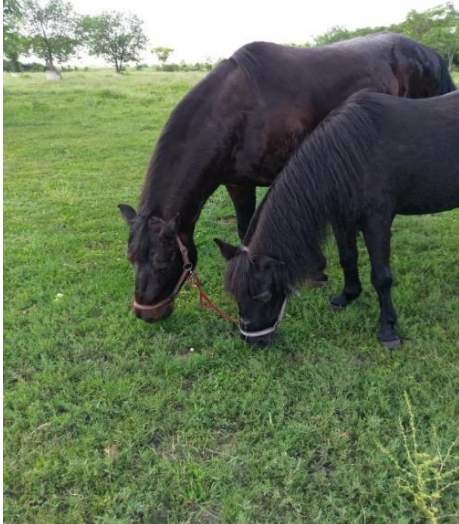
Ghan, 21-jährig, führt seine blinde, cirka 30-jährige Mutter überall hin