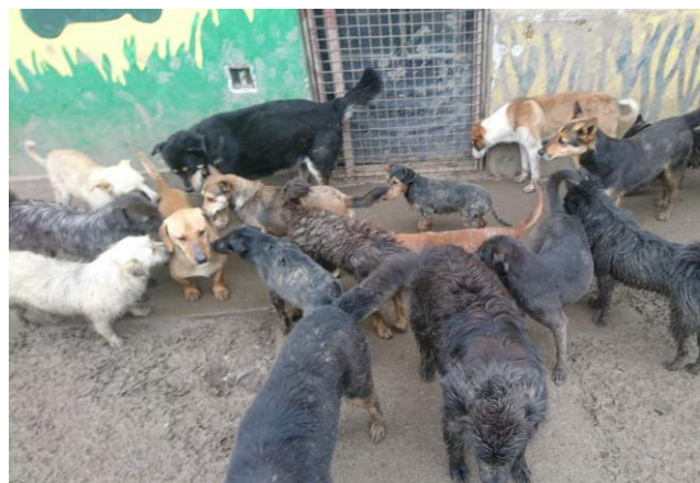
Lebenslange Haft in staatlichen Tierheimen

Diese zehntausenden von Tieren kann niemand retten ... alleine ein Umdenken in der Mentalität der Bevölkerung und die strenge Ausübung des Gesetzes, d. h. strengste Geld- und Gefängnisstrafen für die Aussetzung von Tieren, können eine Besserung bringen. England mit seinem neuen Gesetz sollte Serbiens Vorbild sein. Dort sind neuerdings für jegliche Art von Tierquälerei 5 Jahre Gefängnis vorgesehen.