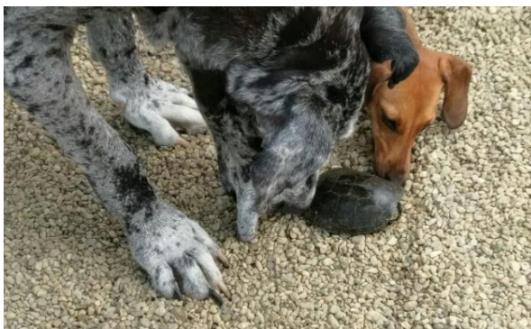
Shelley und Mandy finden eine Wasserschilkröte