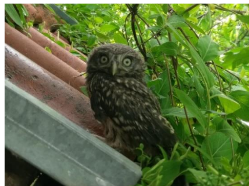
Junges, neugieriges Käuzchen