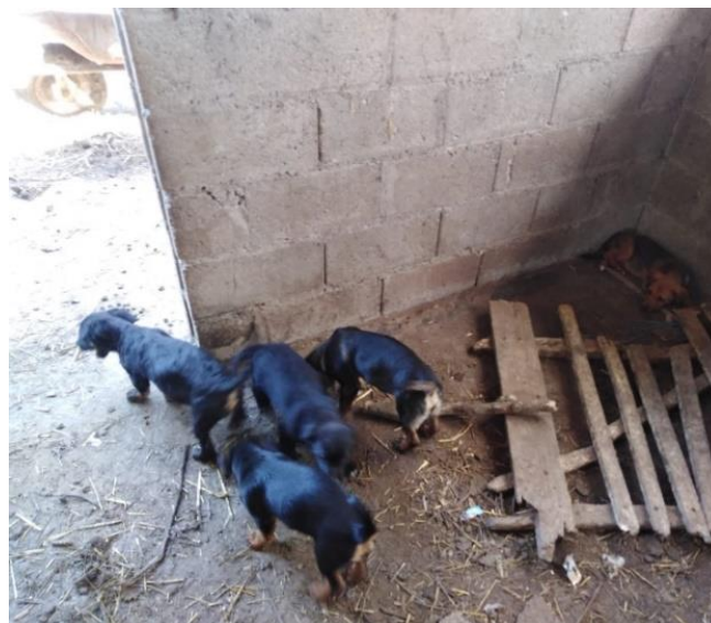
Tausendfaches Tierleid wegen psychisch gestörten Leuten

Eine strenge Kontrolle wäre auch da dringendst nötig ... vielleicht, wenn der Staat einmal aufhört, das Problem zu ignorieren, könnte auch dieses traurige Kapitel gelöst werden.