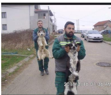
Hier ein paar Beispiele ...