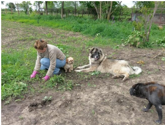
Schara bei der Gartenarbeit