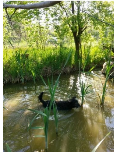
Auf dem Spaziergang