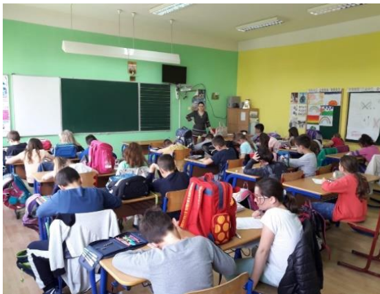
Prüfungstag der Kinder

So sind die 1'236 Kinder, welche im letzten Schuljahr unseren Kurs "Tier- und Naturschutz" besucht haben, eine Freude mit dem Hintergedanken natürlich, dass Tiere und die Natur davon profitieren.